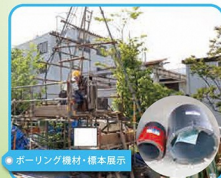
ボーリング機材・標本展示