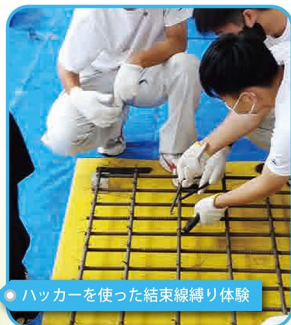
ハッカーを使った結束線縛り体験