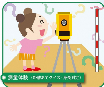
測量体験 (距離あてクイズ・身長測定)