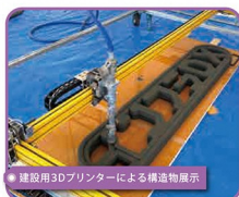
建設用3Dプリンターによる構造物展示