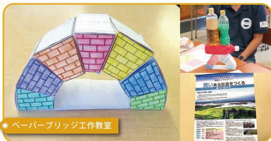
ペーパーブリッジ工作教室